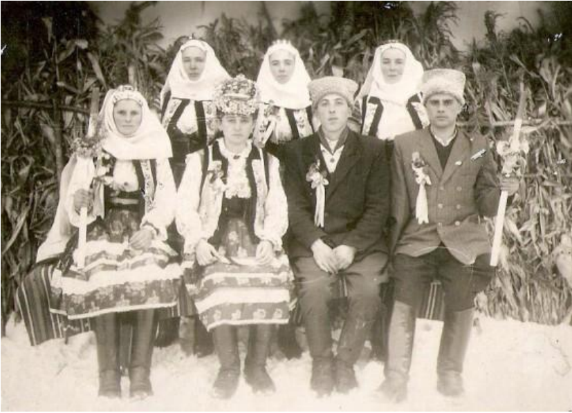
Весільне фото на фоні утеплення-загаті, зробленого із кукурудзиння. Борщівський район, Тернопільщина.

Щоб тепло трималося в оселі протягом всієї зими, господині вдавалися також до магічних дій та замовлянь. Так, треба було встати вдосвіта, до схід сонця встигнути розтопити у печі й швиденько закрити заслінку із примовкою: „Покров, натопи хату без дров!” або „Заганяю тепло в хату, щоб нам всім не хорувати!” (Полтавщина). З хати виносили також троїцьку зелень, яка оберігала протягом літа від відьом і усього лихого, а в садку на зиму обв'язували перевеслом плодові дерева (Чернігівське й Житомирське Полісся).