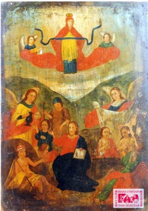
“Покрова Богородиці зі сценою зцілення розслаблених”. II пол. XIX ст. Дніпропетровська обл., м.Новомосковськ. Дерево, олія

В Київській Русі свято Покрови почали відзначати приблизно з 1165 року. І хоча Покрова не відноситься до дванадесятих свят (12-ти найважливіших свят Православ'я), в українському традиційному календарі вважається великим „годовим” святом, пов'язаним із культом Пресвятої Богородиці.