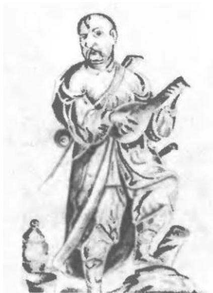
Невідомий художник. Козак-бандурист. XVIII ст.