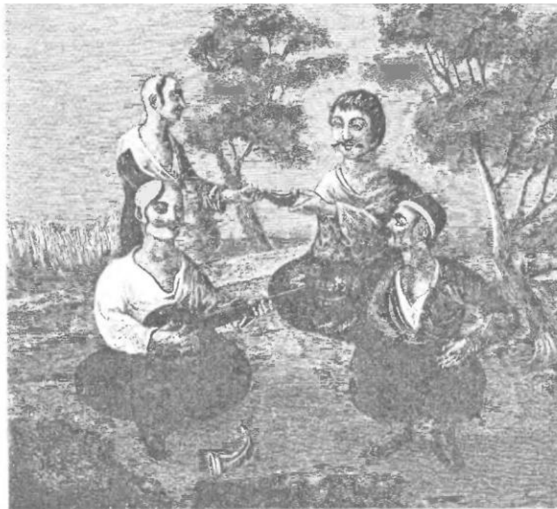
Ч. I. Рис. 3.