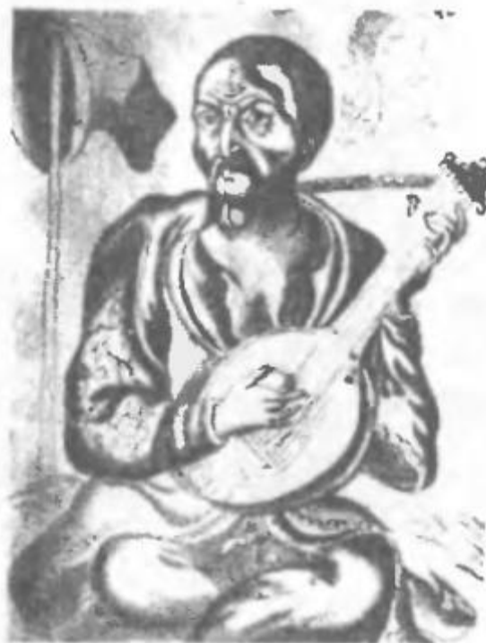
Г. Малярєнко. Козак-бандурист. XVIII ст.