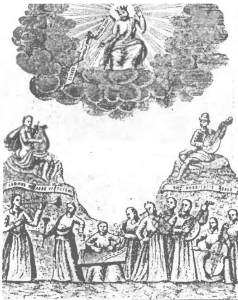
"Олімп". (З панегірику 1730 р.)