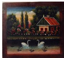
Народна картинка "Сільський краєвид", автор невідомий. Сер. ХХ ст. Україна. Фанера, олія КН-8459

Folk painting "Village landscape" [narodna kartynka "Sil's'kyi krayevyd"]. Painter unknown. Mid-20th c. Ukraine. Oil on panel