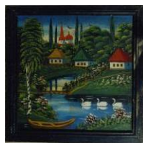
Народна картинка "Сільський краєвид", автор невідомий. Сер. ХХ ст. Черкаська обл., Шполянський р-н. Фанера, олія КН-12399

Folk painting "Village landscape" [narodna kartynka "Sil's'kyi krayevyd"]. Painter unknown. Mid-20th c. Cherkasy Province, Shpola District. Oil on panel