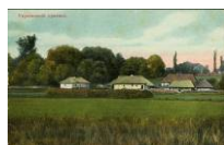
Тло – листівка з серії "Українські краєвиди". Поч. ХХ ст.