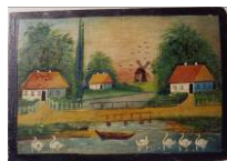
Народна картинка "Сільський краєвид", автор невідомий. 1920-30-ті рр. Полтавська обл., Новосанжарський р-н, с.Мала Перещепина. Фанера, олія КН-7533

Folk painting "Village landscape" [narodna kartynka "Sil's'kyi krayevyd"]. Painter unknown. 1920-30s Poltava Province, Novosandzhary District, Village of Mala Pereshchepyna. Oil on panel