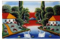
Народна картинка "Сільський краєвид", автор невідомий. Сер. ХХ ст. Черкаська обл., Черкаський р-н, с.Кумейки. Скло, олія КН-9035

Folk painting "Village landscape" [narodna kartynka "Sil's'kyi krayevyd"]. Painter unknown. Mid-20th c. Cherkasy Province, Cherkasy District, Village of Kumeiky. Oil on glass