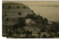
Тло – листівка поч. ХХ ст. Краєвид Канівщини. Архів І.М.Гончара

Folk painting "Village landscape with a windmill" [narodna kartynka "Sil's'kyi krayevyd z vitriakom"]. Painter unknown. Mid-20th c. Ukraine. Oil on panel