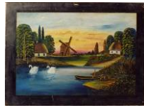
Народна картинка "Сільський краєвид з вітряком", автор невідомий. Сер. ХХ ст. Україна. Фанера, олія КН-13090

Folk painting "Village landscape with a windmill" [narodna kartynka "Sil's'kyi krayevyd z vitriakom"]. Painter unknown. Mid-20th c. Ukraine. Oil on panel