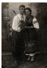
Фото "Закохані", автор невідомий. 1920-ті рр. Народні типи і вбрання Чернігівщини, м.Бобровиця Збірка Івана Гончара [1911–1993] – альбом "Україна й Українці", т.12 – "Чернігівщина" КН-12740/8

Народна картинка "Два голуби", автор невідомий. II пол. ХХ ст. Україна Скло, олія, фольга НДФ-928