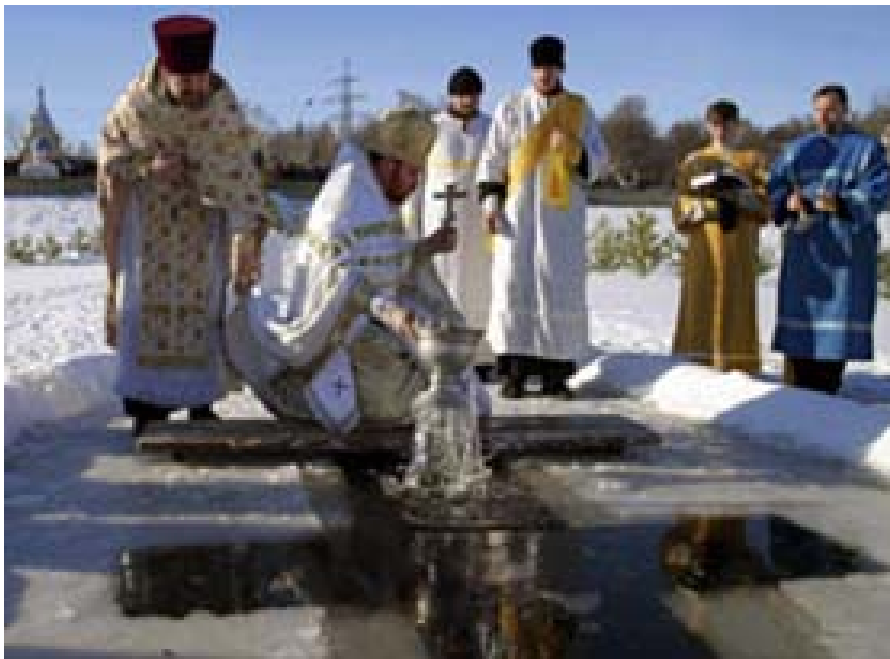
Минулорічне водохрещення на Київському морі біля Вишгорода. Воду освячує настоятель церкви Бориса і Гліба.

Святим Богоявленням, Хрещенням Господа Бога та Спаса нашого Ісуса Христа завершується цикл зимових свят.