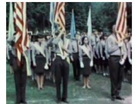
Любомир Гузар – відео з 1968 року