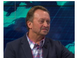
Українці Канади і наступний Торонський фестиваль